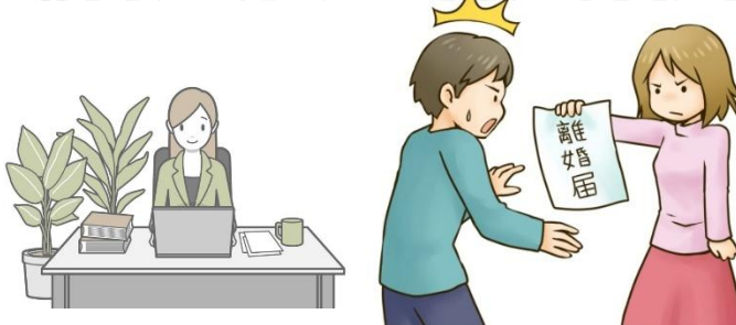
離婚する前に、離婚後の生活設計を考えて